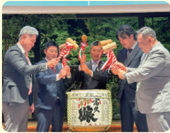
上尾ものづくり協同組合青年部会 創立50周年記念式典 「ありがとう50年、これからも50年」

末筆ながら、皆様のご健勝とご多幸を心よりお祈り申し上げ、御礼のご挨拶とさせていただきます。