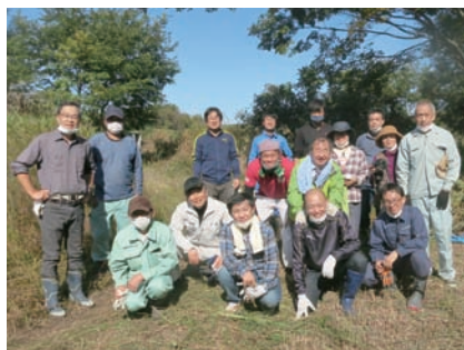
環境保全活動集合写真

八月下旬〜十月の比較的コロナ禍が落ち着いていた時期にそれぞれ第一回目を開催しました。また新型コロナウイルス対策と名付けたセミナー(二回)やリーダー養成実践セミナー、ものづくり創造セミナーを開催しました。親睦事業であるボウリング大会、暑気払い、ゴルフ大会については、どうしても三密を伴うため開催が難しい状況が続いていますが、野外での環境保全活動については実施されました。 なおイベントに代わるものとして、組合員に非接触体温計・消毒液、賛助会員に非接触体温計を配布しました。 まだまだ、新型コロナウイルス感染は続いています、一日も早くコロナ禍が収束し、組合事業が実施できるようになることを願っています。