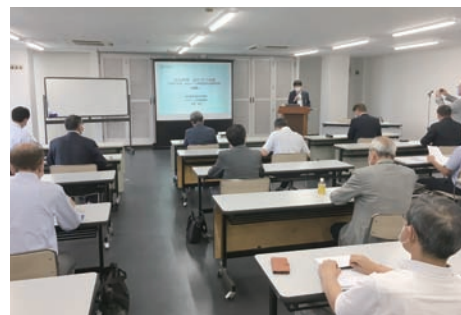
第1回新型コロナウイルス対策セミナーの会場風景