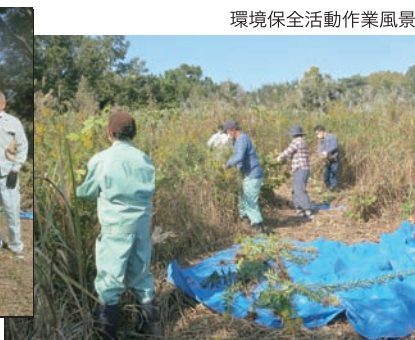
環境保全活動作業風景